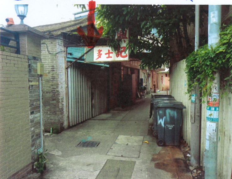
3a 士多 - 元朗大嶺嶺