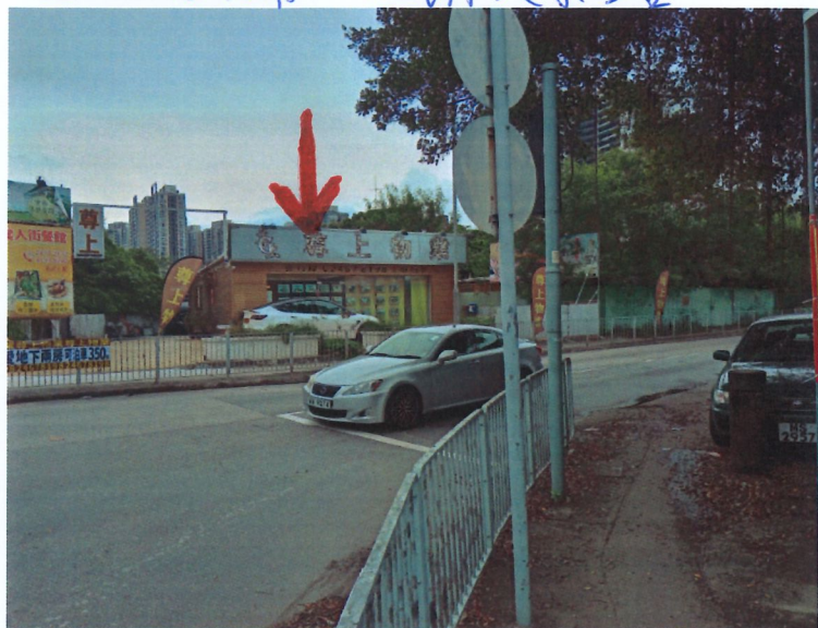
⑤b 地產舖 - 元朗大棠路