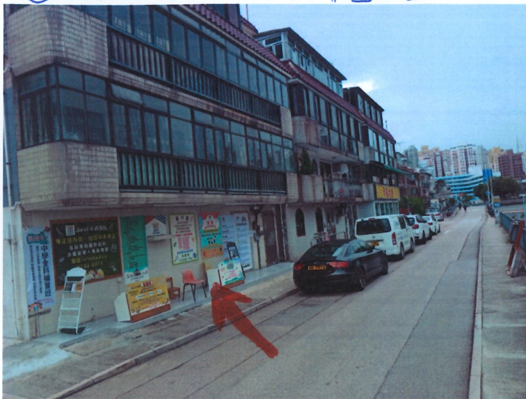
⑥ 補習社 - 元朗公庵路