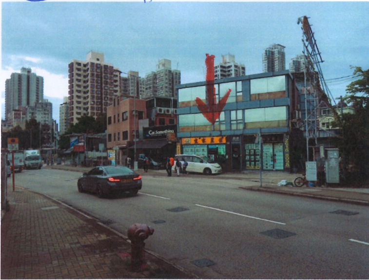
5e 地產舖 - 元朗大棠路