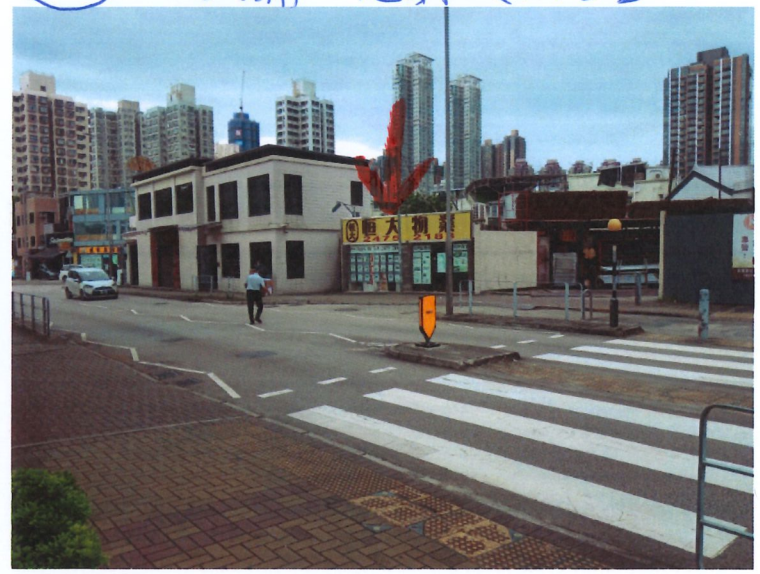
5f 地產舖 - 元朗大棠路