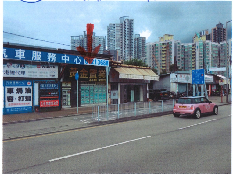
5d 地產舖 - 元朗大棠路