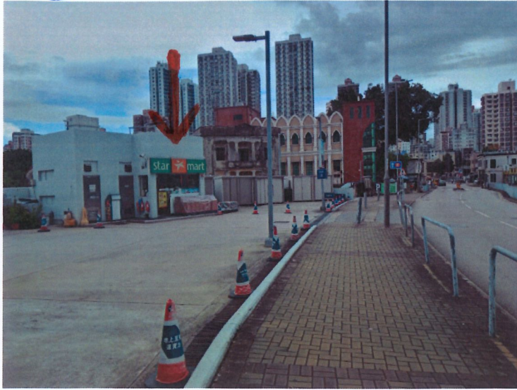
2b 便利店 - 元朗大棠路油站內